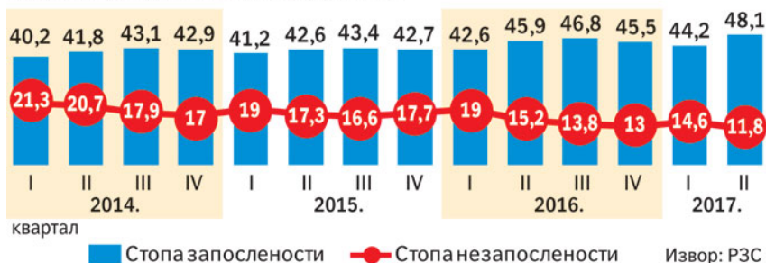
Слика 3. Запосленост у Србији у периоду 2014-2017. године

Поред веома ниске индустријске производње, за разлику од осталих транзиционих економија, прерађивачка индустрија Србије је за девет транзиционих година изгубила 47% индустријских радника, тако да је крајем марта 2010. године у прерађивачкој индустрији било запослено око 320.000 радника.