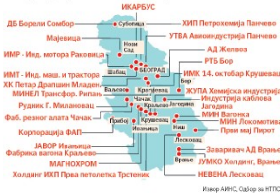
Слика 1. Индустријска мапа Србије

Индустријска мапа обухвата највеће произвођаче у Србији.